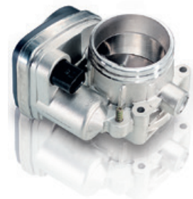
Elemente de acționare motor