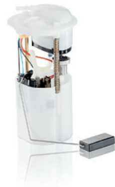
Sisteme de alimentare cu combustibil