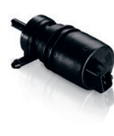
Sisteme de curățare geamuri și faruri