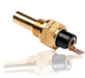
Senzori pentru instrumentare