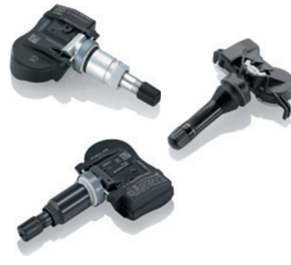
Sisteme de monitorizare a presiunii în pneuri