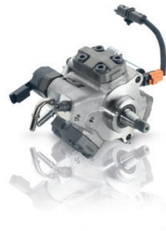
Sisteme diesel Common Rail