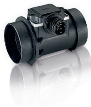
Senzori pentru managementul motorului