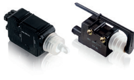
Elemente de acționare pentru sistemele de închidere centralizată